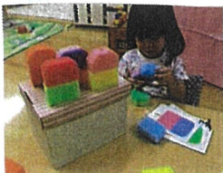
アイスキャンディー