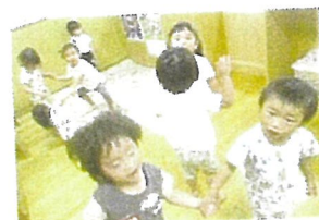
友達と手をつないで踊るフォークダンスが大好きです。