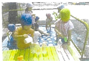
ペットボトルの口に水を注ぎ込むことが上手になりました。