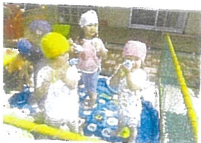
水鉄砲の的あてが一段とパワーアップしました。