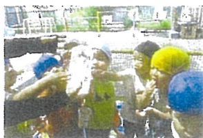
水を触ったり色水遊びが楽しかったね。